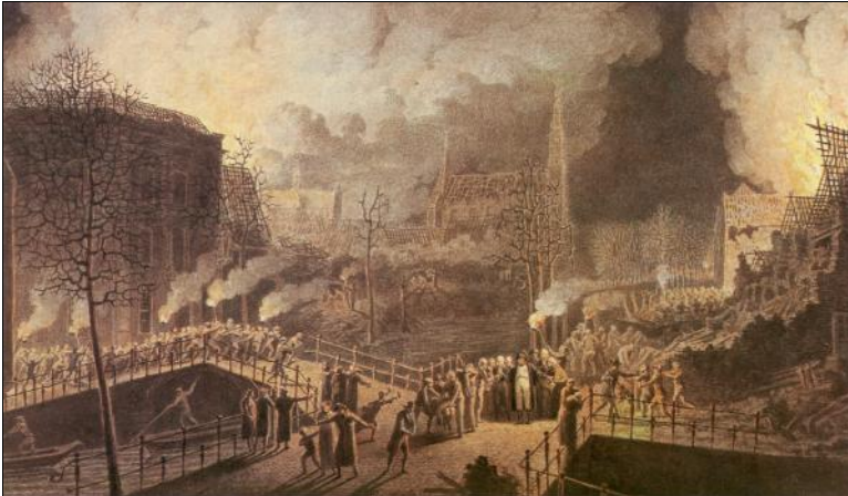
Koning Lodewijk Napoléon was zeer snel ter plaatse in de zwaar getoffen stad Leiden.

Nu zijn naam toch is gevallen realiseer ik mij ineens dat deze, ons door het oudere broertje Napoléon Bonaparte opgedrongen Vorst, een van de beste zaken is die wij als natie moesten ondergaan. Hij heeft het in die paar jaar (1806-1810) van zijn regering werkelijk prima gedaan; en liep veel minder aan de leiband van zijn sterke broer dan men aanvankelijk vreesde. Echt een postzegel waardig. En omdat dat nog steeds niet gebeurde lijkt 2006 het ideale moment. Het past m.i. beter dan die voetbal-ijdeluiterij waar we nu mee bezig zijn.