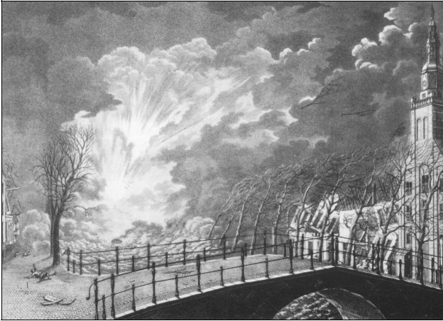
De Sint Lodewijkskerk blijft wonder boven wonder staan.

natuurlijk aan het roer. Het is maar een veronderstelling, maar zo gaat het vaak op die scheepjes. Het is best mogelijk dat een vaatje buskruit is geopend om het vuurtjestoken in de kajuit sneller te doen verlopen; immers op een praam zo volgeladen mist men één, twee vaatjes niet. En dan was de invalide koksmaat misschien wel erg onhandig met zijn aardappeltjes. Het is niet te achterhalen. Ook professor Knappert bleef na zijn grondige studie in 1906, honderd jaar na de ramp van Leiden, in het ongewisse.