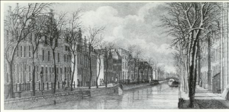
Het Rapenburg voor en na de ontploffing van het kruitschip.